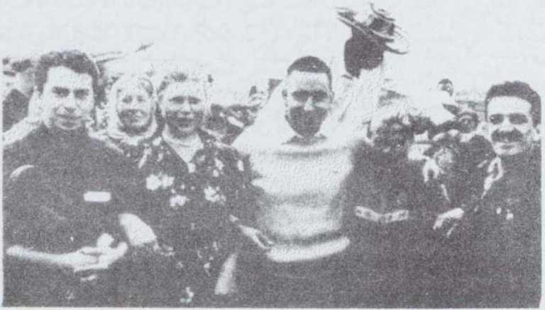
في الاتحاد السوفياتي، ١٩٥٧، في أقصى يمين الصورة