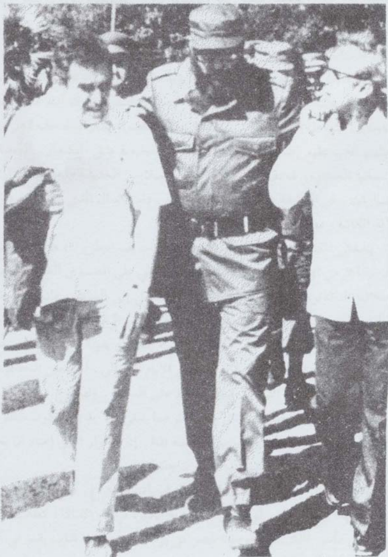
عائيل عرسية مباركيز (على يسار الصورة) مع ميدل كاسترو في كوبا، ١٩٧٨