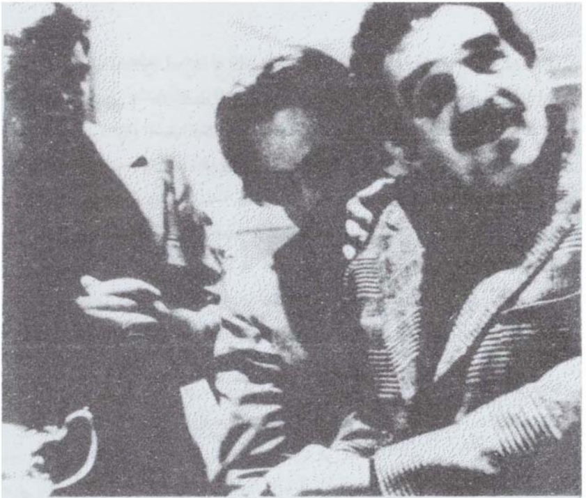
ماركيز مع الكاتب الشبكي ميلاد كوندرا (على يسار الصورة) والفرنسي ريجيس دوبويه (الوسط) باريس، ١٩٨٠