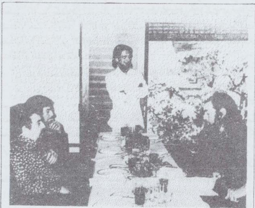
مع خوليو كورناتار، كارلوس باراك، والكاتب البيروي ماريو فارغاس جوسا، في برشلونة، ١٩٧٠