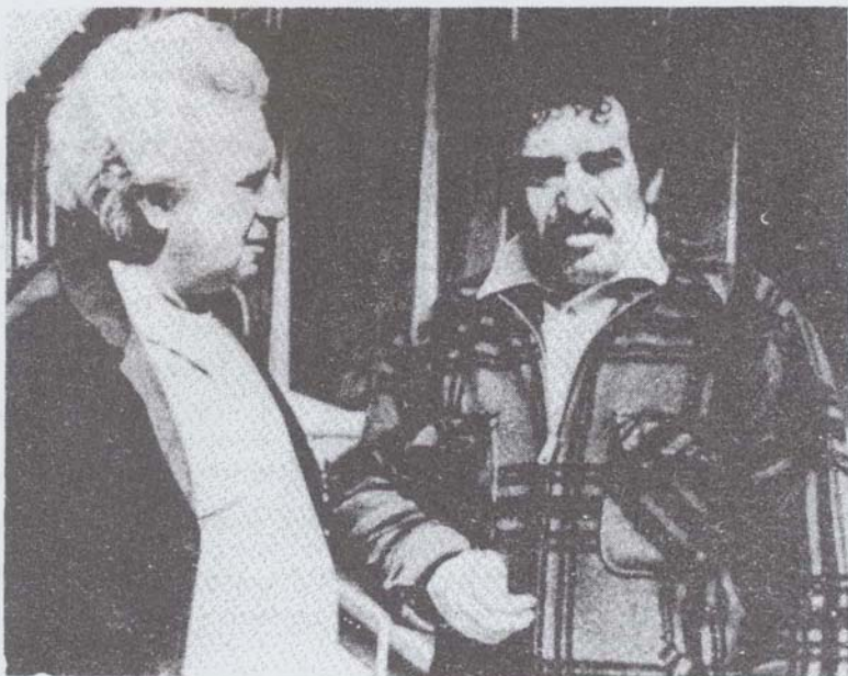
غابرييل غارسيا ماركيز مع الكاتب البرازيلي جورج أمادو