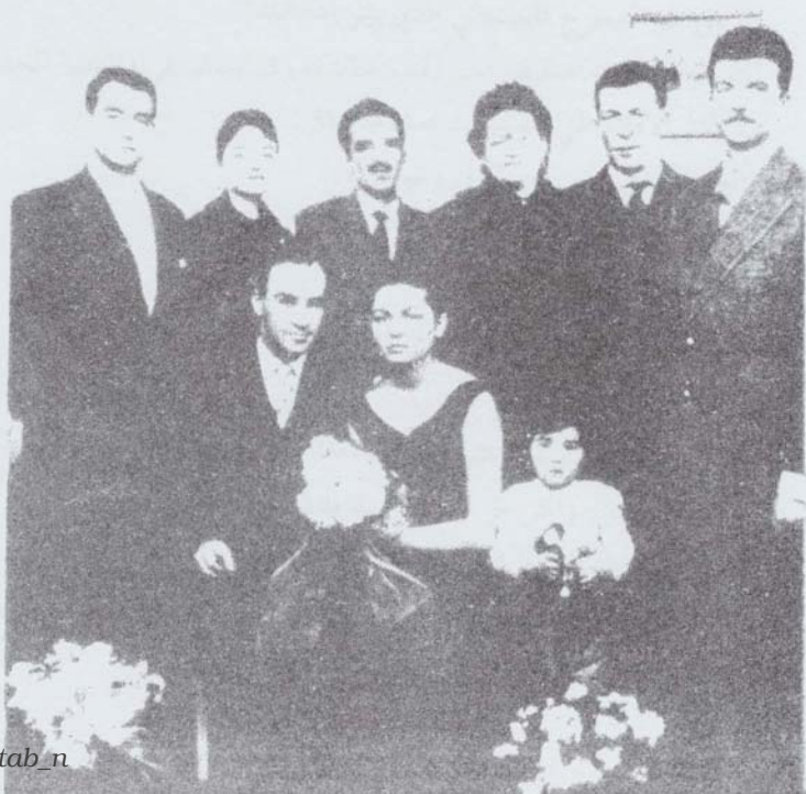
عائيل فاطمة ماركيز (الضيفت اعلمني) البسيط) في باريس، 1967، في حفلة زواج صديقي