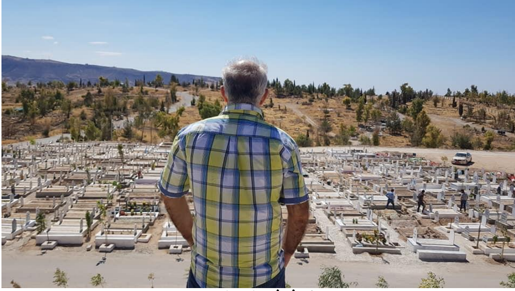
بدل رفو في مقبرة شاخكي