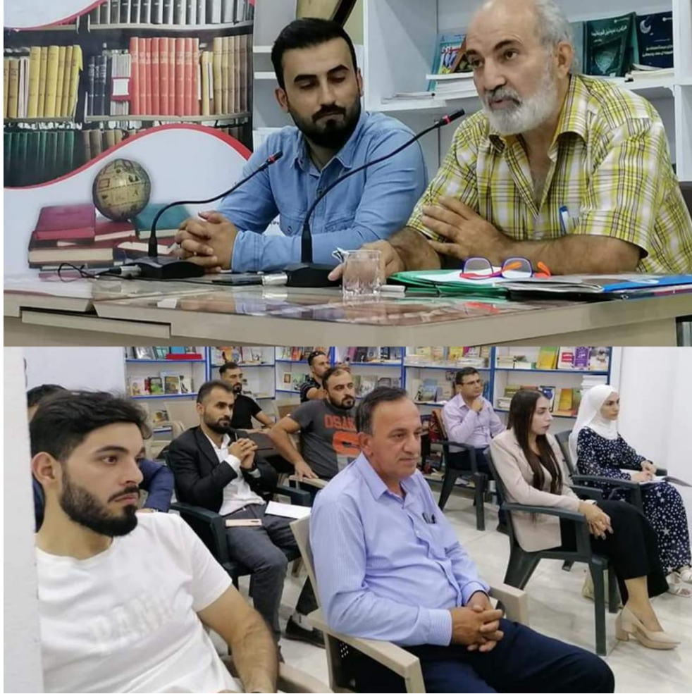
محاضرة مكتبة زيندا

محاضرة في مكتبة زيندا الثقافية في تناهي يوم ٢٠٢١/١٠/١٤ للتحدث حول مسيرته ما بين كوردستان والعالم شعرا وترجمة وادب رحلات!! حضر الجمهور من مدن زاخو وقصروك ودهوك المركز !! استغرقت المحاضرة ١٢٠ دقيقة