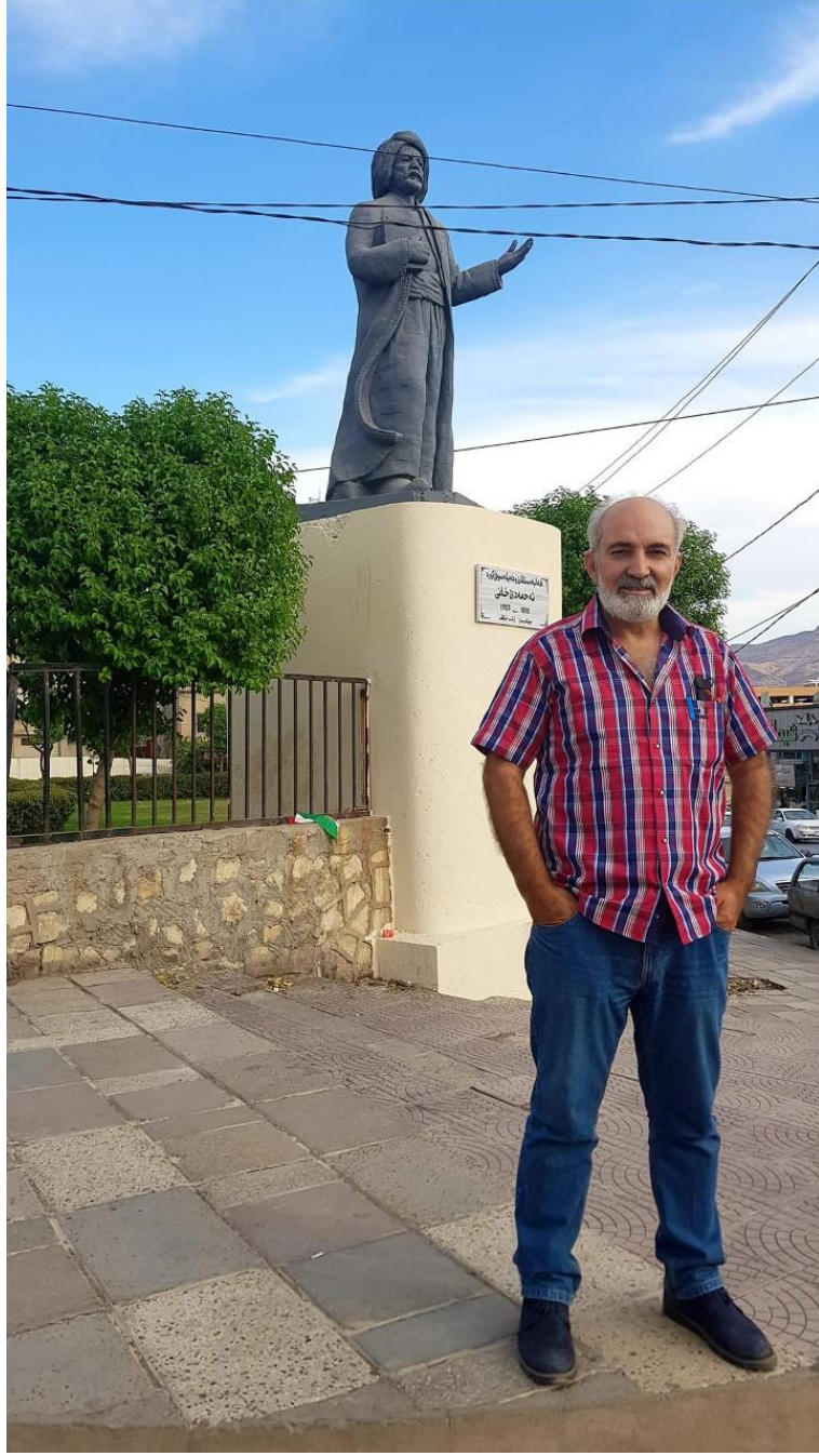
دهوك، امام تمثال الفيلسوف والشاعر الكوردي احمد خاني 1650 - 1707