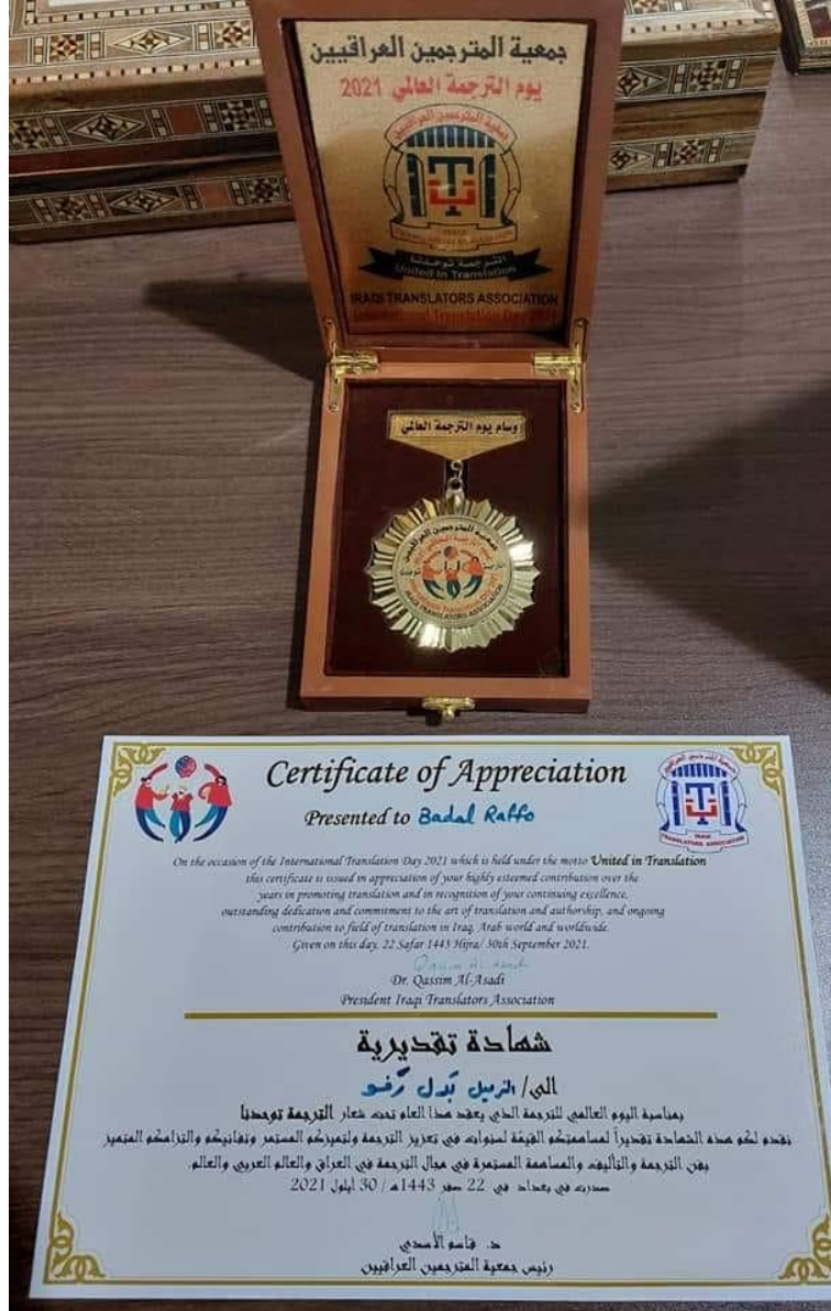
وسام الترجمة للشاعر والمترجم بدل رفو