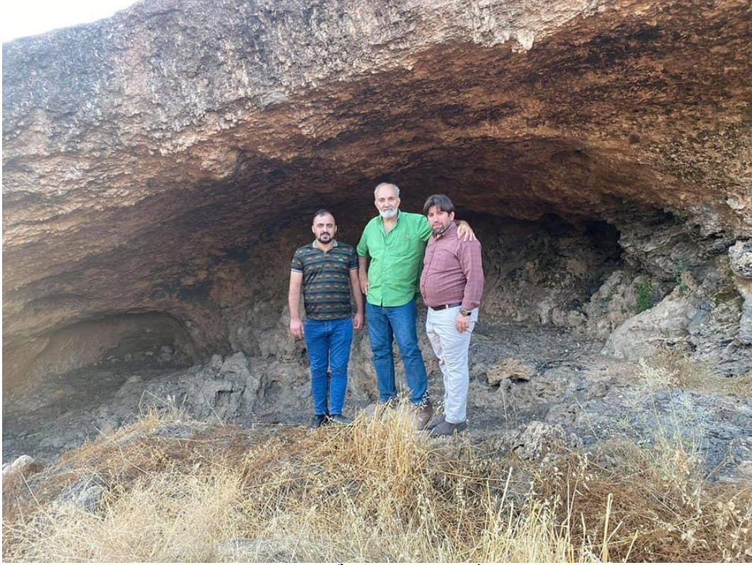
في جبل الخير وقرية خوورت