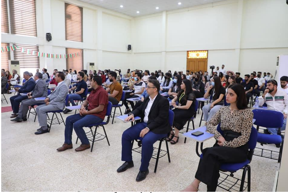
محاضرة بدل رفو في جامعة دهوك