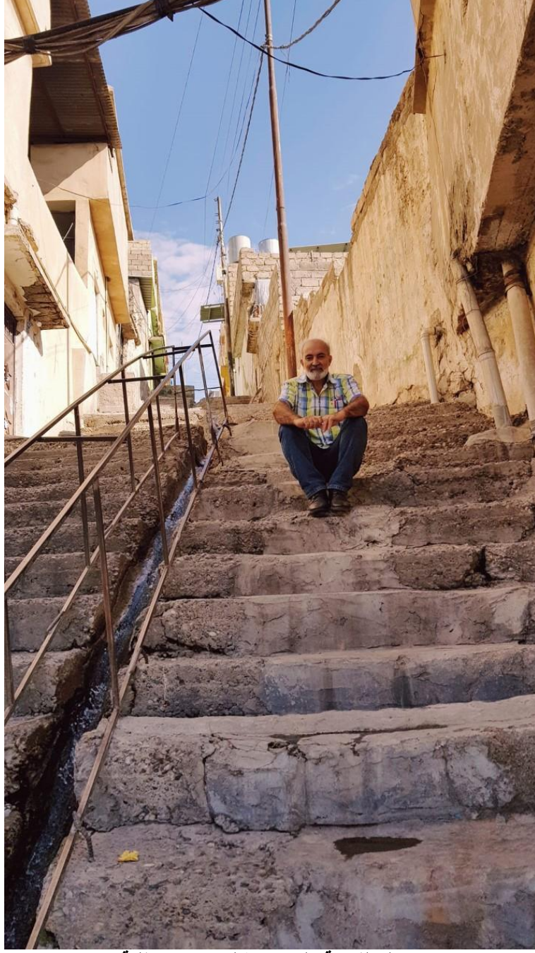
دهوك القديمة وليست سلام جزيرة صقلية

بدل رفو يحاول في دهوك اكتشاف المخفي الجميل عن عيون الاخرين وينشر صورة جميلة وينشرها في مواقع التواصل الاجتماعي قائلا: